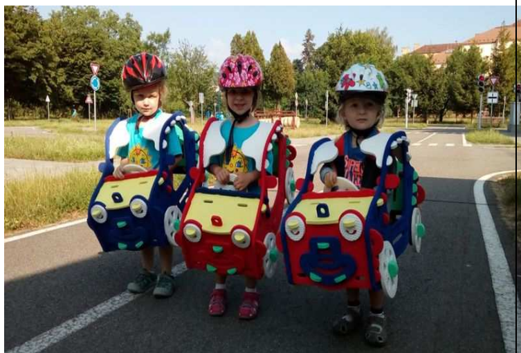
Školka na dopravním hřišti v Kroměříži, červen 2018